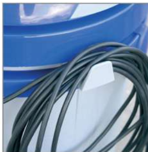
A Cuve en acier inox- stainless steel tank